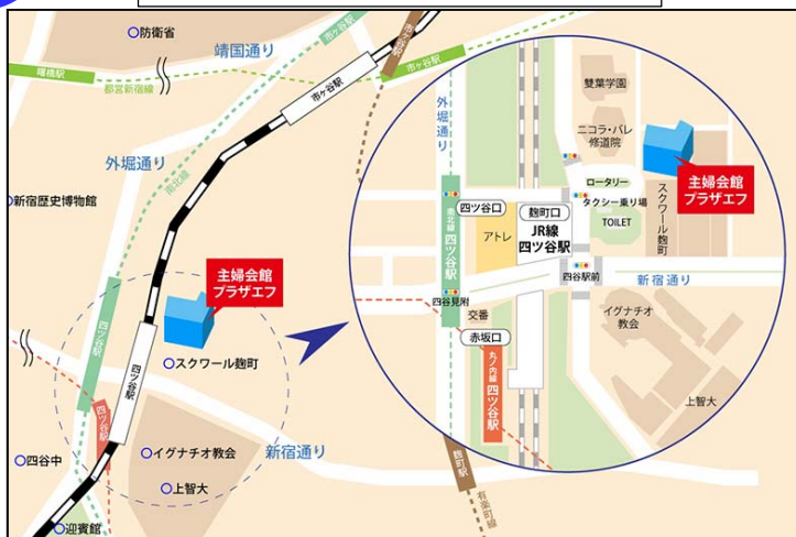
東京会場: 主婦会館プラザエフ