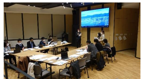
大学生が編集会議でプレゼン！