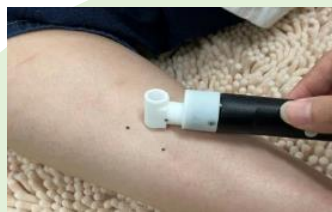
②角層水分量測定 ③水分蒸散量測定 イメージ

※モニター募集時のアンケート結果により 実施しない測定項目がある可能性があります。